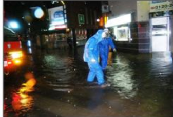
(平成22年7月 福島県郡山市)